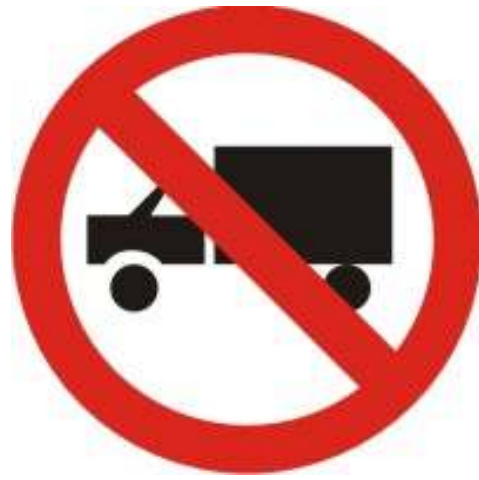
Proibido trânsito de caminhões