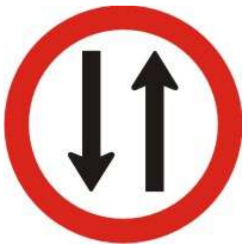
Duplo sentido de circulação