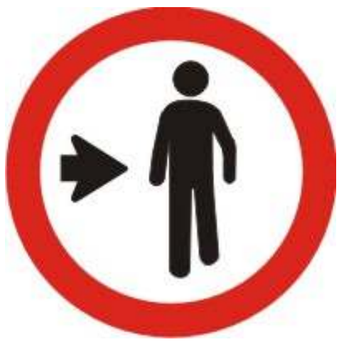
Pedestre, ande pela direita