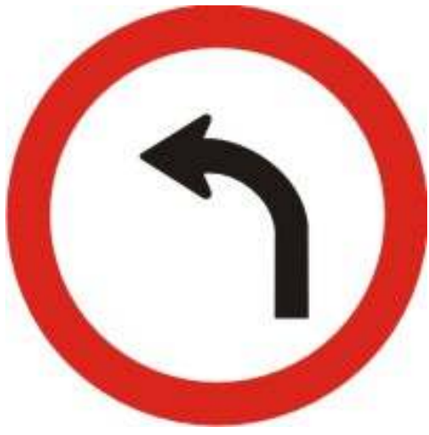
Vire à esquerda