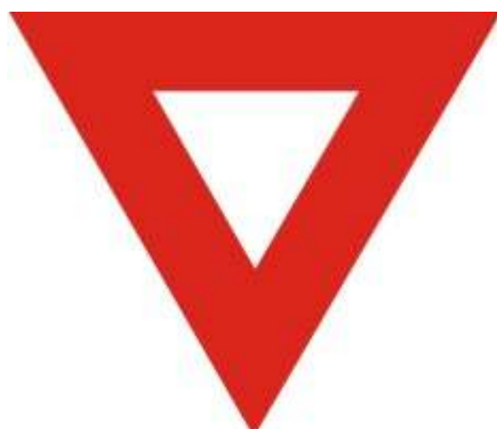
Dê a preferência