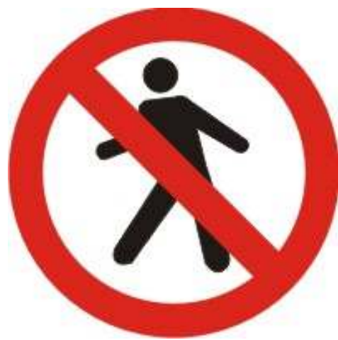
Proibido Trânsito de pedestres