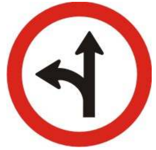
Siga em frente ou à esquerda