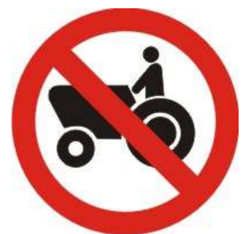
Proibido trânsito de tratores e máquinas de obras