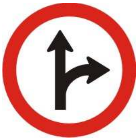
Siga em frente ou à direita