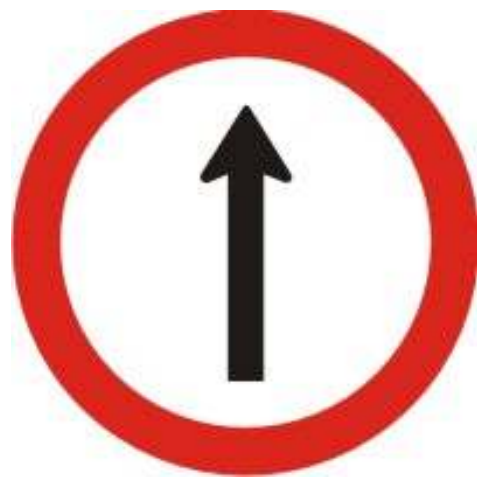
Siga em frente