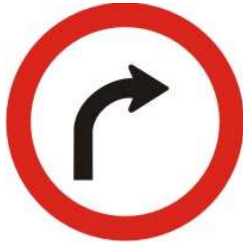
Vire à direita