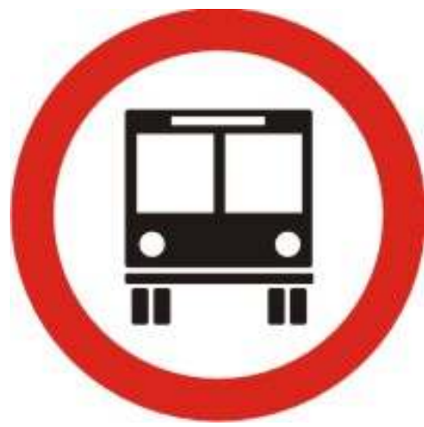
Circulação exclusiva de Ônibus