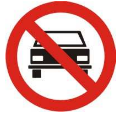
Proibido trânsito de veículos automotores