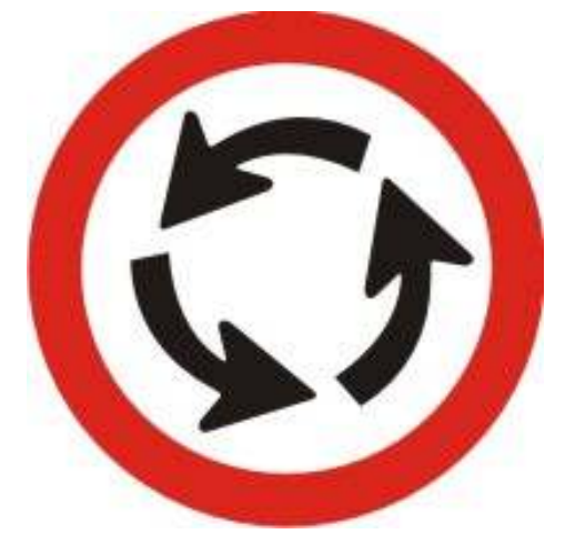
Sentido de Circulação na rotatória