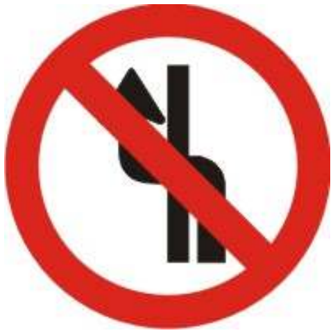
Proibido mudar de faixa ou pista de trânsito da direita para esquerda