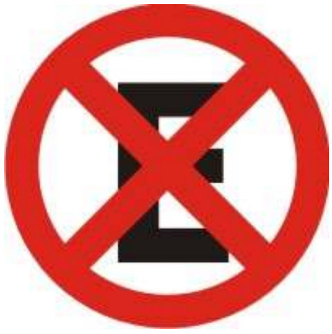
Proibido parar e estacionar