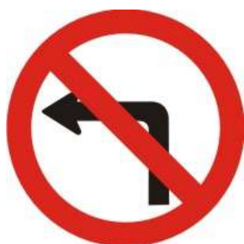
Proibido virar à esquerda