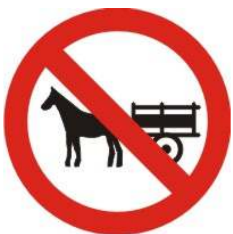
Proibido trânsito de veículos de tração animal