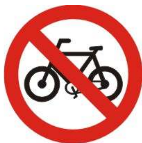
Proibido trânsito de bicicletas