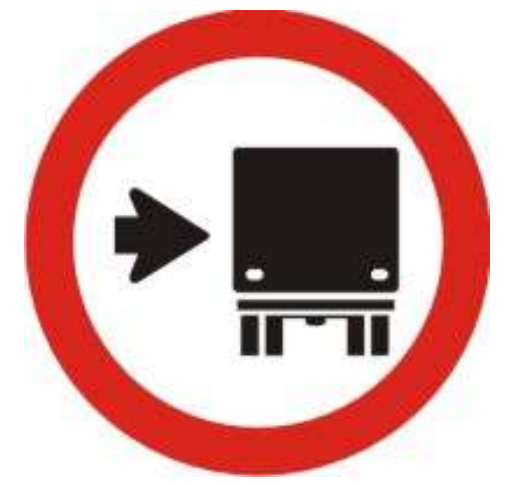
Ônibus, caminhões e veículos de grande porte mantenham-se à direita