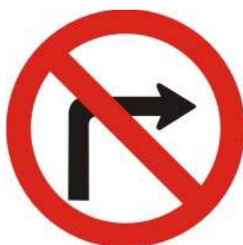
Proibido virar à direita