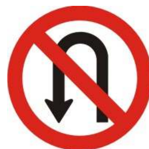
Proibido retornar à esquerda